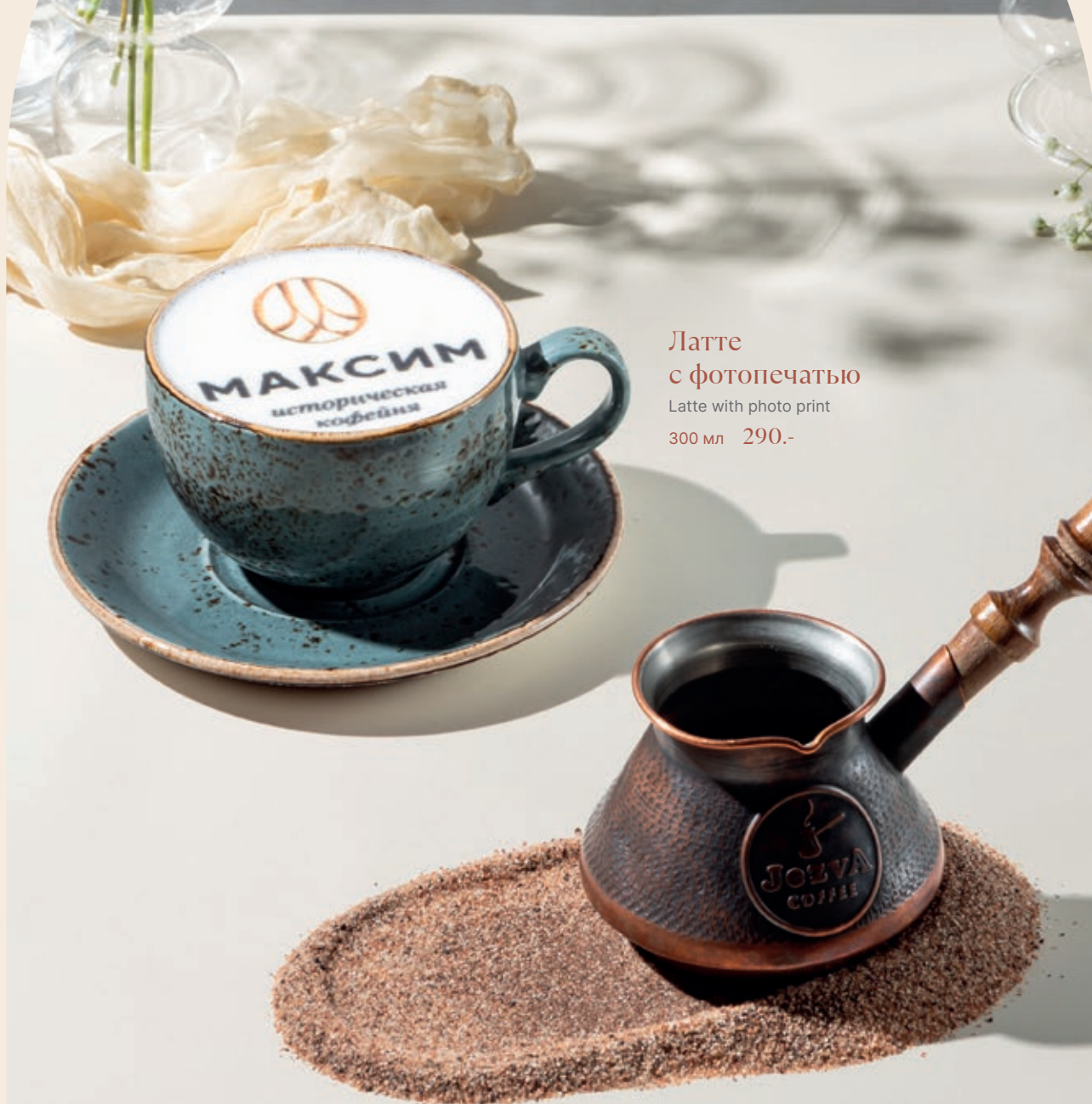
Латте с фотопечатью Latte with photo print 300 мл 290.-